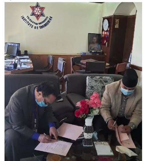
Figure 1 MoU Signing Ceremony

त्रिभुवन विश्वविद्यालय, इन्जिनियरिङ अध्ययन संस्थान (IOE), पुल्चोक, ललितपुर, नेपाल र लुम्बिनी बौद्ध विश्वविद्यालय (LBU), स्कूल अफ डिभेलपमेण्ट स्टडिज एण्ड एप्लाइड साइन्सेज, रुपन्देही, नेपाल, बिच बौद्ध वास्तुकला र इन्जिनियरिङ शिक्षामा आपसि सहयोग र सहकार्यका लागि भएको सहमति पत्रमा हस्ताक्षर भएको छ।